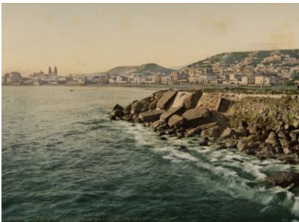
Puerto de Las Palmas. Gran Canaria. 1893