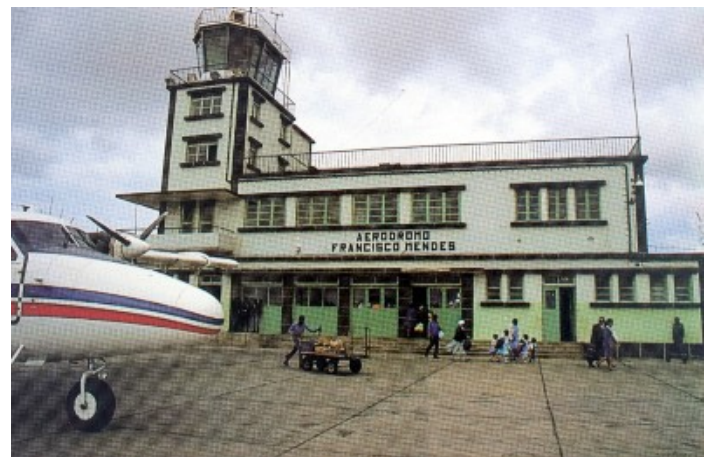
Aeródromo de Praia. Santiago. 1978