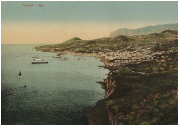
Puerto y bahía de Funchal. 1893