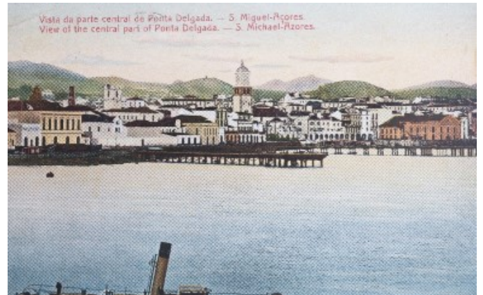
Puerto y bahía de Ponta Delgada 1900